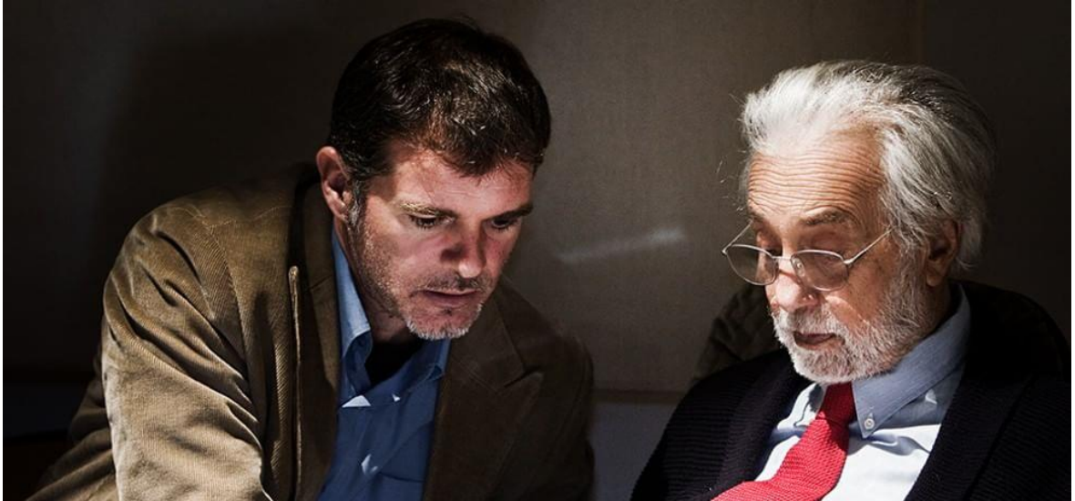
Stefano Massini nel 2015 con Luca Ronconi, poco prima della sua scomparsa. Lo sostituirà come consulente artistico del Piccolo Teatro.

C'è l'accordo Cei-governo per riaprire dal 18 maggio i luoghi di culto in occasione delle messe con le adeguate misure di sicurezza. E immediata scatta la reazione dello scrittore Stefano Massini che in un video aveva già comparato una chiesa a un teatro, mettendo alla pari la libertà di culto a quella di godere di un prodotto culturale come uno spettacolo dal vivo.